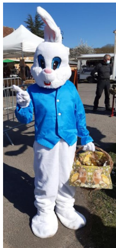
Le Lapin'Houx lors du marché du 2 avril