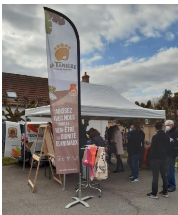
Le zoo refuge La Tanière lors du marché du 5 mars