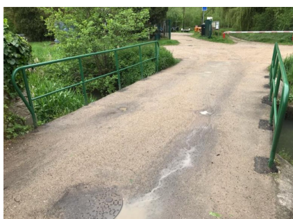
Remise en état des barrières du pont du lavoir