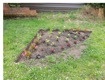
Rue des carreaux