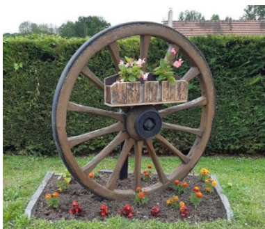
Entrée du village (côté rue de la Villeneuve)