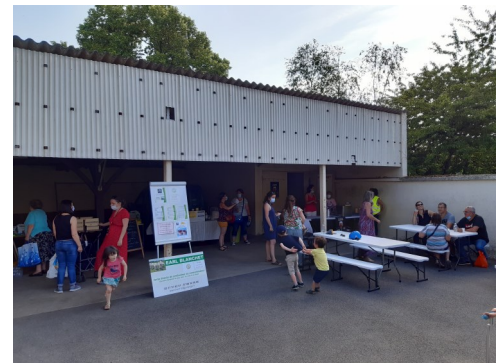
Installation d'une buvette lors du marché du 11 juin