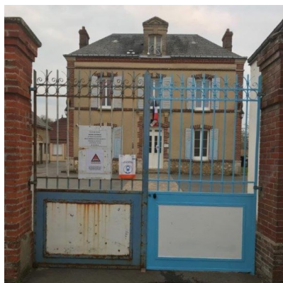
Remise en état du portail de la Mairie