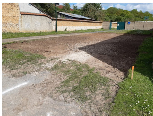
Terrains de pétanque en cours de réalisation...