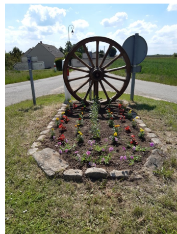
En haut de la rue de Mairie (carrefour direction Gas et Hanches)